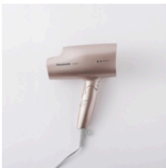
ヘアードライヤー ナノケア EH=NA57 オ ープン価格/PANASONIC