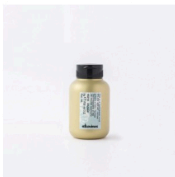
DAVINES モアインサイド ニノ ¥2,600/COMFORTJAPAN