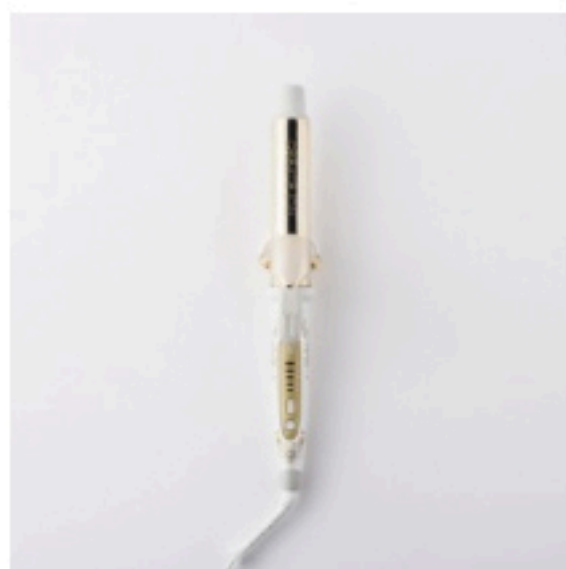
クレイツ イオン アイロン グレイスカール 32mm ¥9,500/CREATE ION