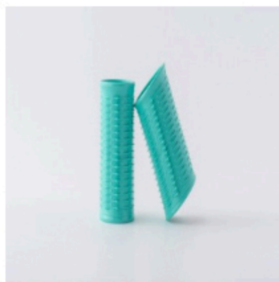
カールン8 EH9301P オープン価 格/PANASONIC