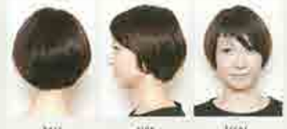
back side front