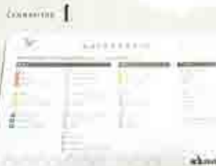
お客さまの 髪質チェック

ホームケアのためのアドバイスを受け 頭皮のトラブルはストレスや睡眠の不足、自宅で使 用しているケア剤の影響することが多いもの。サロ ンでは話をしっかり聞いて改善できるポイントを探 索してくれる。