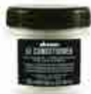
ダヴィネス オイ コンディショナー 250mL 2,800円+税