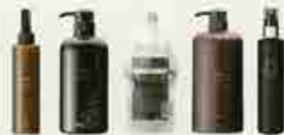
左から R-21 トニック 180mL 1,000円(詰替) R-21 シャンプー 280mL 700mL 700mL(詰替) R-21 スカルブパック 250g 400g R-21 トリートメント 250mL 700mL 700mL(詰替) R-21 スカルブケア HE 120mL 400mL

「R-21」シリーズは、ハリ・ コシのなきが気になる方、 スタイリングが思い通りに決 まらない方、頭皮を健やかに 保ちたい方などにお勧めです。 サロンケアでは5つのステッ プで、スクアルブケアのメニ ュー提案もできます。