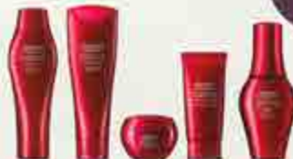
左から サ・ヘアケア フェューチャーサプライム シャンプー 250mL 2,8 00円、500mL 4,600円、450mL (R) 3,800円、サ・ヘアケア フェュー チャーサプライム トリートメント 250g 3,500円、500g 5,600円、45 0g (R) 4,500円、サ・ヘアケア フェューチャーサプライム マスク200g 5,000円、サ・ヘアケア フェューチャーサプライム デンスフィールプライマ ー<ヘアトリートメント> 洗い流さないタイプ 80g 2,500円、サ・ヘアケ ア フェューチャーサプライム トータルスカルブケアセララム<頭皮用美容液> 125mL 5,000円、450mL (R) 12,000円