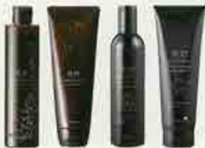
左から R-21 シャンプー 280mL 2,100円 R-21 トリートメント 250g 2,400円 R-21 シャンプー エクストラ 260mL 3,200円 R-21 トリートメント エクストラ 230g 3,200円