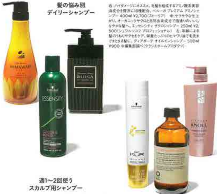
髪の悩み別 デイリーシャンプー

大人が最低限常備すべきはこの3種類。この3つがあれば、1か月のヘアケアスケジュールのサイクルにバッチリ対応。