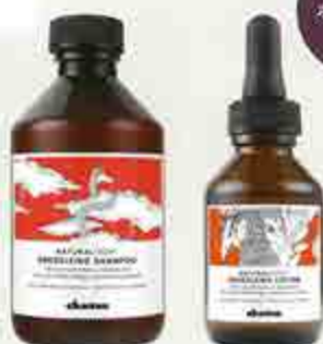
左から ナチュラルテックシャンプー<E> 250mL 2,200円 ナチュラルテック スカルブローション<E> 100mL 8,600円