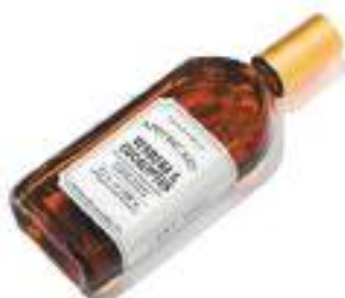
05. ROOM SPRAY