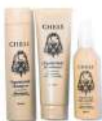
18. MOISTURIZE HAIR