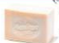
27. OLIVE SOAP