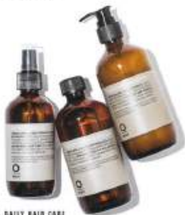
09. DAILY HAIR CARE