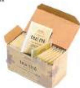
19. HERBAL TEA