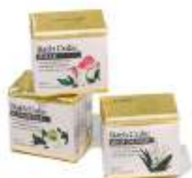
25. BATH CUBE