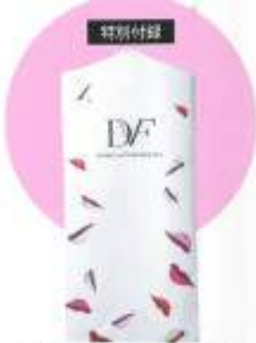
特別付録 ダイヤモンドファステンパー 洋服カバー