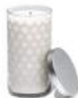
15. VEGETABLE WAX CANDLE