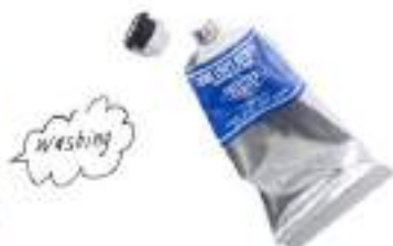
23. BODY CREAM