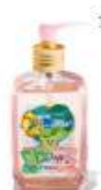
17. OIL TREATMENT