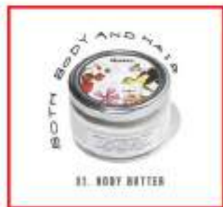
03. BODY BUTTER