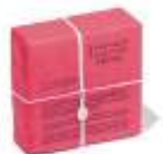
10. FACIAL SOAP