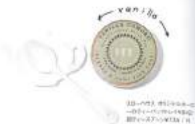
10. BLEND TEA