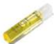
20. ORIGAN ALMOND