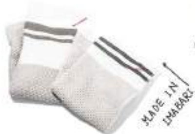
11. COTTON LINEN TOWEL