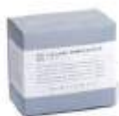
27. LAUNDRY POWDER SOAP