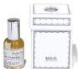
02. EAU DE PARFUM