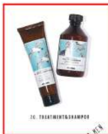
20. TREATMENT & SHAMPOO