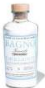
06. BATH SALT