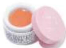
01. LIP BUTTER