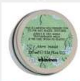
●このアレンジで使ったスタイリ...