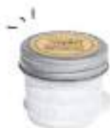
08. RETRO CANDLE