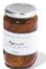
12. FRUITS COMPOTE