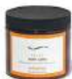
16. RELAX BATH SALT