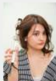
●How To Arrange