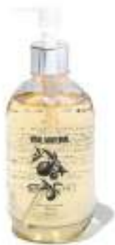
04. BERGAMOT HAND SOAP