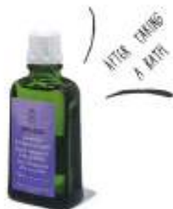
13. LAVENDER BODY OIL