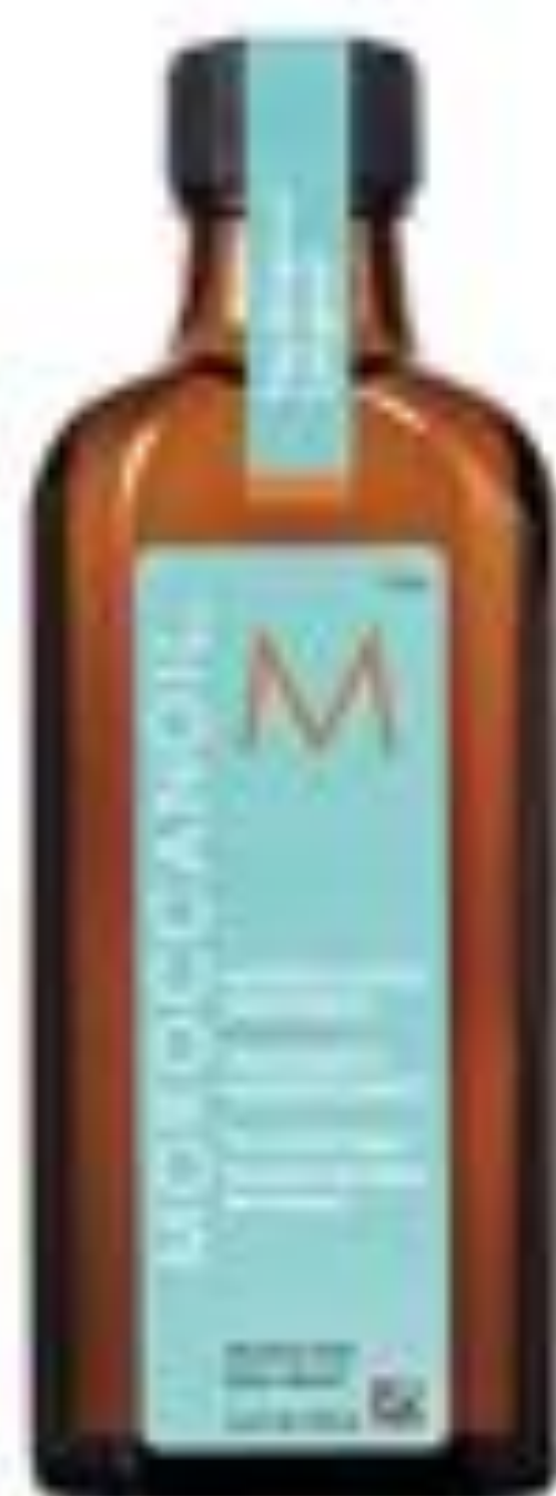
モロッカンオイルトリートメントライト 300ml ¥4,300

「毛髪は、しっとりめに仕上がるやや重めの感触で甘い香りのオイルがお気に入り。バサつきが落ちます」