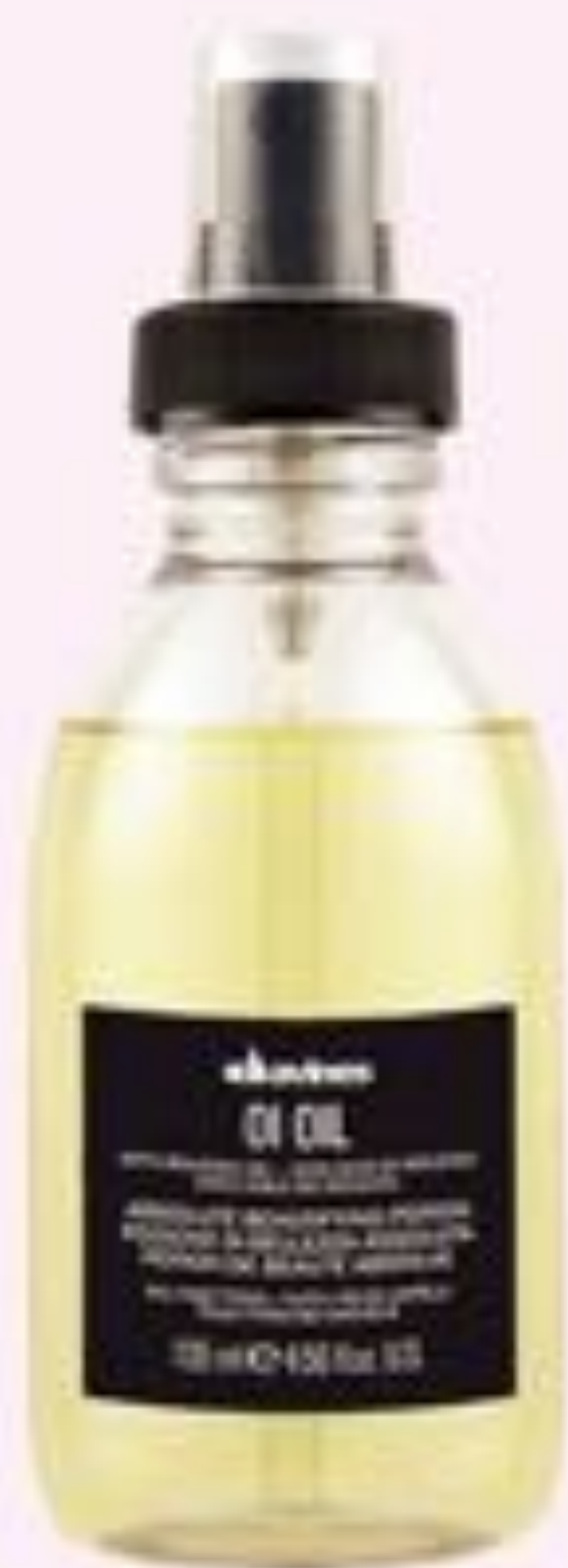
ダヴィネス オイオイル L 135ml ¥4,700/コンフォートジャパン

自然な仕草も色っぽい雰囲気になるウェット髪は、こなれ感だって高まるし変身度高め♡彼をドキドキしちゃう作戦に打ってつけのニューヘアなのです！ぜひお試しあれ♡