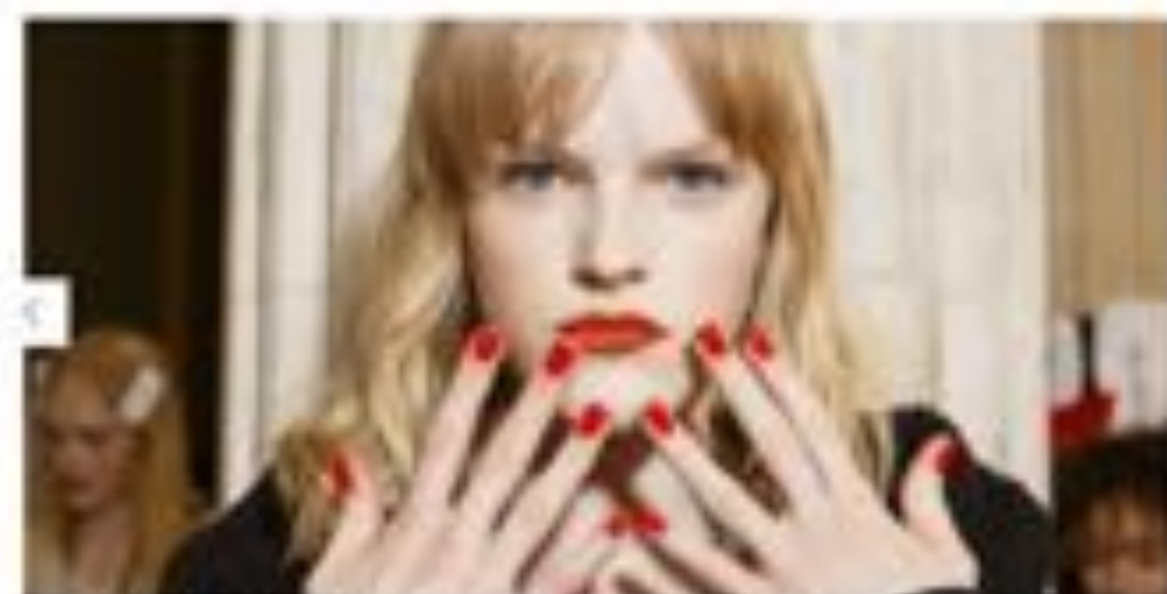
「この夏はコレが流行！」ムーンシー・グリーンが発表する、2018年の注目コスメアイテムは？