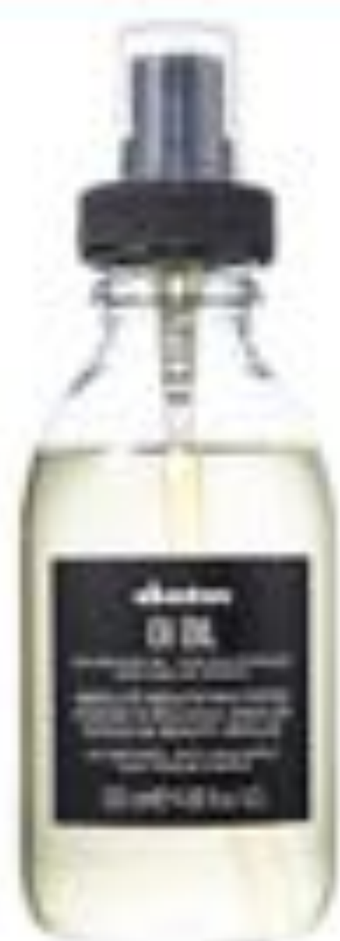
コンフォートジャパンダヴィネスオイル 135ml ¥4,700