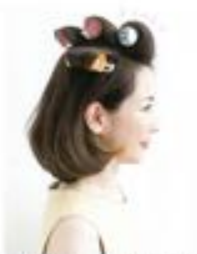
前髪のアイロンカーラーで、トップ3輪、サイド1個ずつ巻き、下の髪にやさせて仕上げ

ランビース ¥42,000 / オットダム 韓国産 (オットダム) / ヒアス ¥6,000 / イマージュ