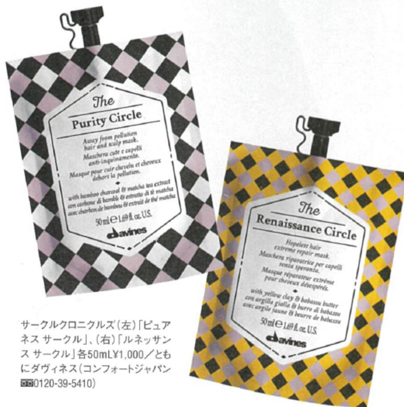
サークルクロニクルズ(左)「ピュアネス サークル」、(右)「ルネッサンス サークル」各50mL ¥1,000 / ともにダヴィネス(コンフォートジャパン) 0120-39-5410

東京のアイコン的なストリートからインスパイアされたアイシャドウは、パールからマットまで多彩な質感がこれひとつに。並木通りの名前を冠した03は、銀杏を思わせるしっとり鮮やかな黄金色やカーキが大人っぽく、目もとの印象がぐっと洗練されます。重ねても色が濁らず、クリアに発色するところもすごい!