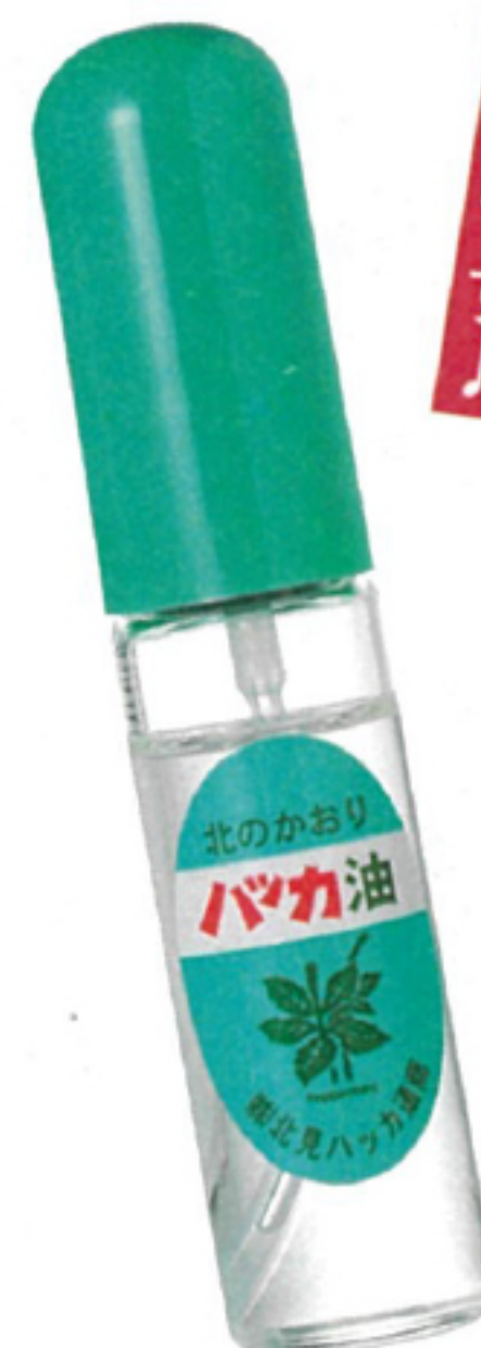
ハッカ油スプレー10mL ¥1,000 / 北見ハッカ通商 0157-66-5655