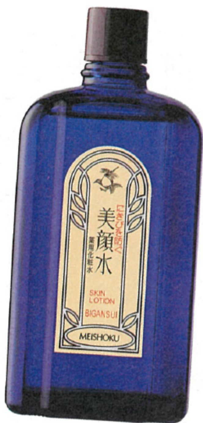
明色美顔水 薬用化粧水 90mL ¥800 / 明色化粧品 0120-12-4680