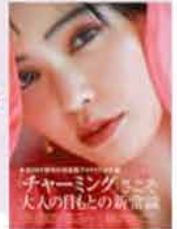
チャーミングミス 大人の目と唇の新常識