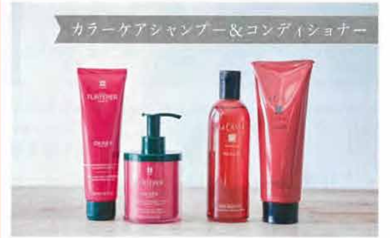
カラーケアシャンプー&コンディショナー

(左) カラーヘアのためのデイリーケアと集中ケア。オカラカラー プロテクトコンディショナー 150mL ¥2,600、プロテクトマスク 200mL ¥4,000 ※3月25日発売/ともにルネ フルトレー、(右) 艶と潤いを与えて、カラー後の髪色をより美しく。アロマ リヴァイタ ヘアソープ 1st 300mL ¥3,000、ヘアマスク 1st 230g ¥3,000/ともにラ・カスタ(アルペンローゼ)