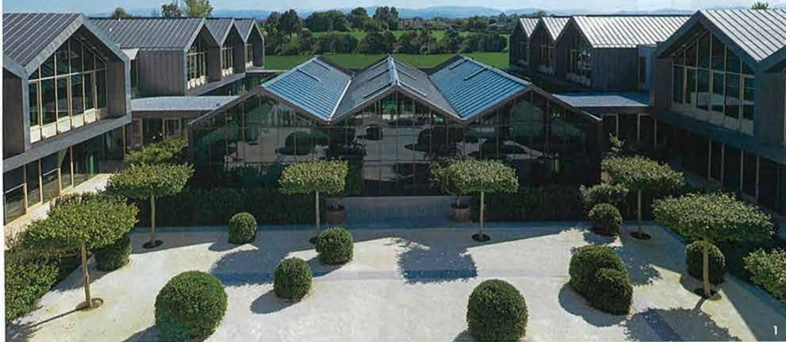
1 敷地の約80%が緑地。ヴィレッジのどこからでも緑豊かな景観を楽しめる設計。3万6000㎡もの庭園には大きな温室と植物園が。さまざまな薬用植物や芳香性植物が栽培され研究開発に役立てられている。 2 ガラスを多用した、自然光がたっぷり差し込む空間。